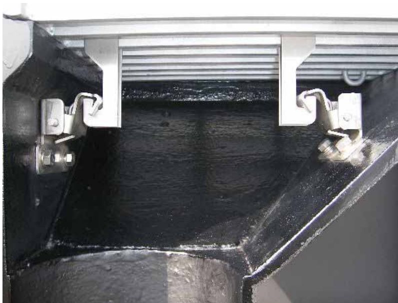
GST-SSP/橋梁・高架排水柵(鑄鉄製)の設置例