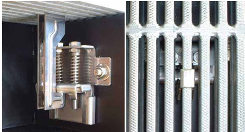
GST-SP(改良型・ダブル)の設置状況 (内部/上部)

維持・管理等のため取り外す場合は、逆の要領で、SPリフトをグレーチング上面の逆U型フックの頭部を跨ぐように差し込み、本体フックに引っかけて静かに引き上げたまま逆U型フックを横にスライドさせ、SPリフト及び逆U型フックを抜き取る。この段階でグレーチングとグレーチングストッパー本体との結束が解放される。