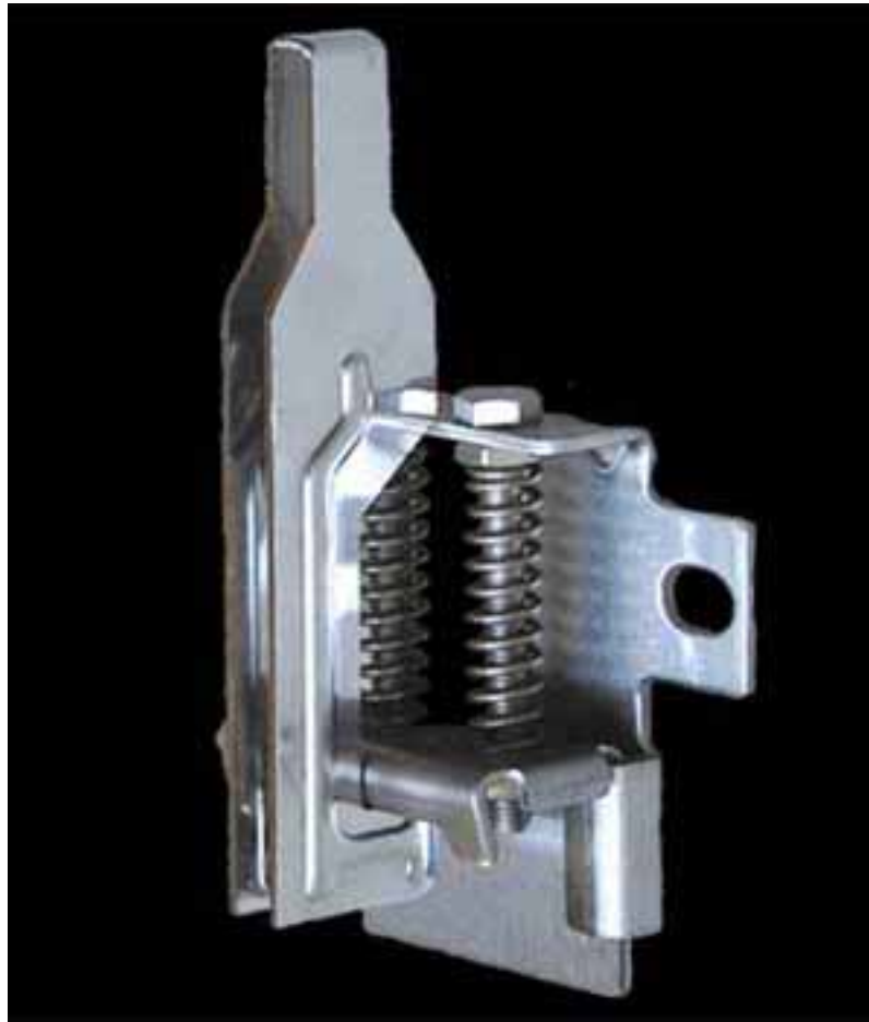
グレーチングストッパーSP(改良型・ダブル)