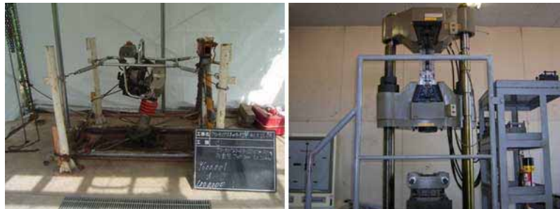
強度試験の状況(打撃耐久性試験/引張り試験)

・グレーチングストッパーSPシリーズ(SP改良型、SPミニ、SSP、SPM)いずれの金具も引張り強度=7(KN/個)以上が得られ、目標引張り強度(自社設定)=6.9(KN/個)以上となり跳ね上がり防止金具としての十分な耐力を確認した。