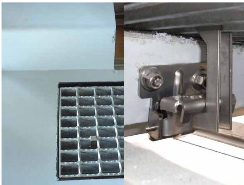
GST-SPM/縁塊への設置例 (上部)/(内部)