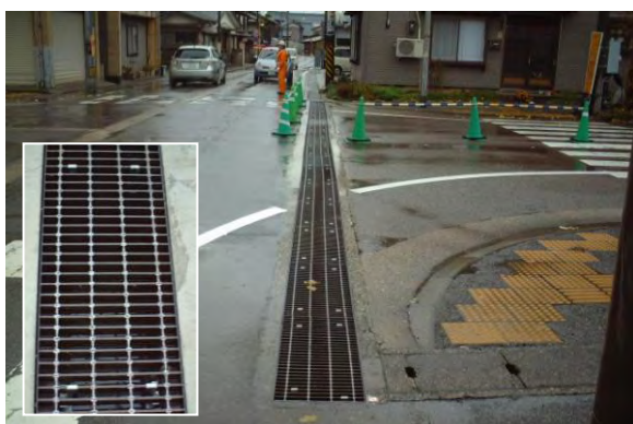
写真-2 横断側溝の設置例 (SP)