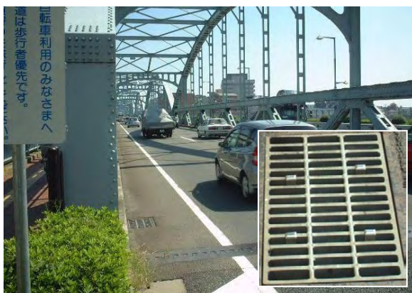
写真-4 橋梁・排水柵の設置例 (SSP)