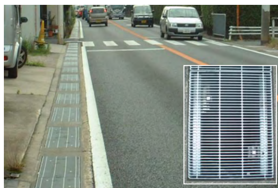
写真-3 道路側溝の設置例 (SPミニ)