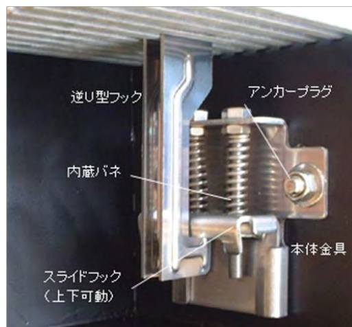
写真-1 固定金具 (SP) の構造・名称

※取付けは、①→⑨の手順で実施。取外し・再設置は、専用治具 (SP リフト) を用いて、⑨→⑥、⑥→⑨の手順を繰り返す。