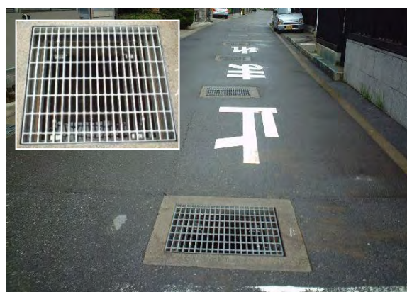
写真-5 縁塊・排水柵の設置例 (SPM)